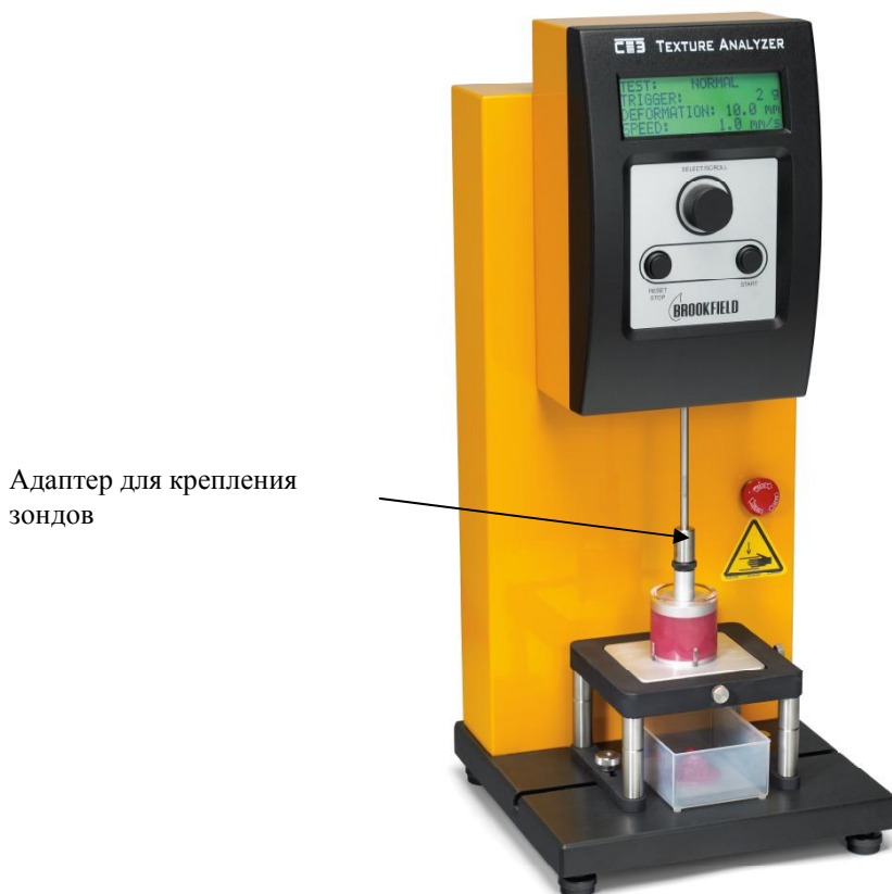
Рисунок 1 - Общий вид анализатора

Общий вид анализатора представлен на рисунке 1.